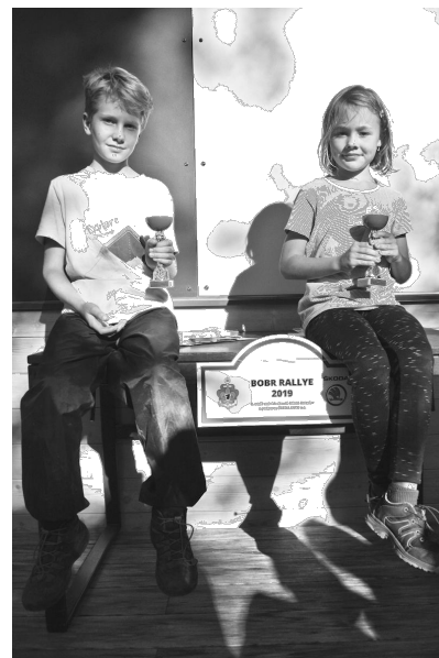
Fotografie z poslední Bobr rallye v roce 2019