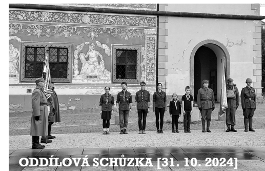
ODDÍLOVÁ SCHŮZKA [31. 10. 2024]