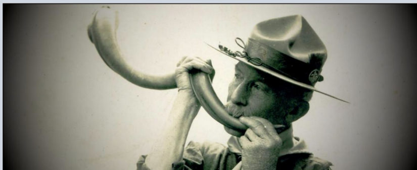
R. Baden-Powell svolává účastníky kurzu v Gilwell Parku, 1922

Píseň Engonyama dodnes ukončuje Gilwellské kurzy připravující na složení nejvyšší vůdcovské kvalifikace. Zpívá se i na některých kurzech jinde po světě a stala se světoznámou písní skautských vedoucích. Zpíval ji několikatisícový chór zulských bojovníků, který spolupracoval s Baden-Powelovou jednotkou při osvobozování obléhané búrské farmy v jižní Africe roku 1885 na jeho počest.