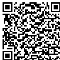
Komunistický režim se začal drodit v Teplicích. Ekologické demonstrace ukázaly, že se lidé už nebojí – ČT24