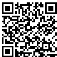
Studenti proti totalitě: Rok 1939 ČT edu