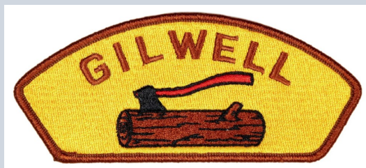
Nášivka Gilwellského kurzu