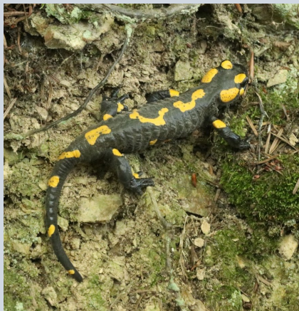
Mlok, kterého jsme potkali na výpravě

V pátek k večeru jsme přijeli do Krhanic, uvařili, postavili spaní a šli jsme spát. V sobotu jsme vstávali o něco později, měli celkově pohodové ráno a po tom všem vyrazili na vodu, kde se k nám ještě připojil Riki. Kolem poledne jsme udělali zastávku na oběd na ohni, kde byl také překážkový běh. Koncem sedmnáctého kilometru v cca 3 hodiny jsme dorazili do Pikovic kde jsme umyli loďe a skočili do vody. V čase čekání na auto s věcmi jsme hráli fotbal, trojnožku a šli jsme na hezkou procházku na kopec, který je údajně středem čech, s poznávačkou přírodnin na závěr. Pak jsme se přemístili na místo ležení u kopce Medník. Večer jsme hráli plížení k náčelníkovi a pak šli spát. V neděli jsme vstali brzo ráno s výběhem a rozcvíčkou na Medníku. Pak jsme dostali šifru o místě kam jdeme, vše sbalili, uklidili a přesunuli jsme se k autu kde jsme si vzali pouze malé batůžky na cestu. Cestou k Štěchovické přehradě a vodní elektrárně jsme hráli čísla. Zastavili jsme se u památníků padlých francouzů v koncentračním táboře, který stál dřív poblíž. Šli jsme po první vyznačené stezce svazem českých turistů a nad zatopenou trempskou osadou Ztracenka. Pak jsme si povídali o vodě v krajině, sbírali kartičky a dali si oběd. Sešli jsme dolů, kde nám Fretka koupil vodu a zkoušeli jsme prolízt zábradlím do kterého se Ještěr nevešel. Poté už jsme šli jenom směrem na vlak, který nám jel ve 3 hodiny. Pak už jsme jen dojeli do Prahy, zkrátili si čas čekáním v parku a nasedli na vlak směrem Mladá Boleslav.