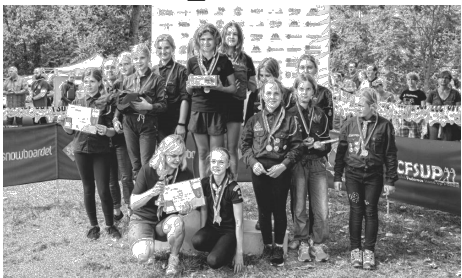
Žabičky na nejvyšším stupni

Zpráva, kterou posíláme do Boleslanu. Takové to naše piárko, jak to dycky děláme.